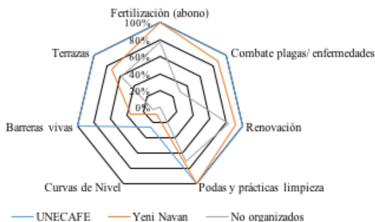
Figura 2. Adopción de innovación de los productores organizados y no organizados